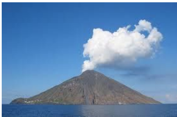
Stromboli Island (and volcano)

The words below are often needed to understand newspaper articles or TV news, as well as Italian geography and geology.